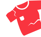
ਖਰਾਬ ਹੋਏ ਕੱਪੜੇ