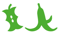
ਫਲ ਅਤੇ ਸਬਜ਼ੀਆਂ