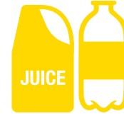
Bottiglie e contenitori di plastica